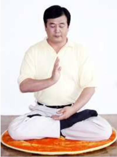
Håndposition - Hold én håndflade rank