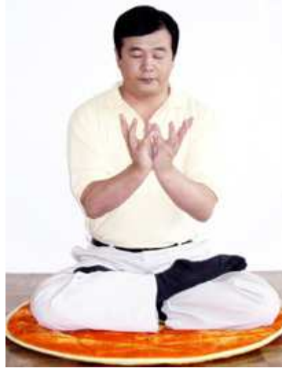
Håndposition - Den store Lotus